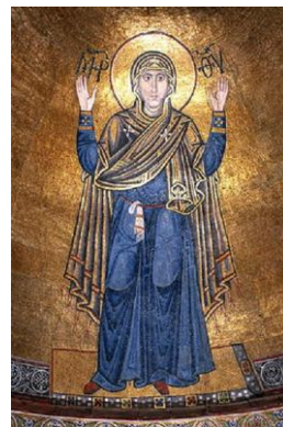
Марія-Оранта з вишиваною хусточкою за поясом. Софійський собор (Київ)