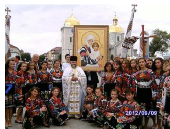
Вишивання борщівської Богородиці у вишиванці

До речі, у борщівському храмі Успіння Пречистої Діви Марії знаходиться особлива ікона Богоматері з Ісусом. Діва Марія одягнена у червоно-чорну вишиванку!