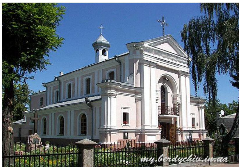
Костьол Святої Варвари в Бердичеві, де вінчався Оноре де Бальзак з Евеліною Ганською 1850 року. Про це нагадує меморіальна дошка і пам'ятник письменнику

14 марта 1850 года в семь утра они венчались в костеле святой Варвары в уездном городе Бердичеве (Николай Островский рассказывал, что во время рейда Первой Конной армии на Варшаву оказался в Бердичеве и увидел в огромном мрачном кармелитском костеле, что в старинной крепости, белую мраморную плиту, на которой золотыми буквами высечена памятная дата венчания Бальзака с графиней Ганской».