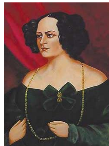
Евеліна графиня Ганська

Неозорий, безмежний, знадний світ Бальзака, в який потрапляє читач цієї книги. В ньому він знаходить і химерні вигадки, схожі на феєрії «Тисяча й одної ночі», і будні подвижницької праці, в який народилися геніальні твори, і тогочасні соціально-політичні події, і бурхливе інтимне життя великого романіста. Ось як розповідає про свої ніжні почуття до Евеліни Ганської великий письменник: «Вже чотирнадцять років, як я люблю тільки одну жінку – щиро, благородно. Я насамперед її друг, що ладен проїхати півтори тисячі льє, аби вдовольнити бодай одну з її примх, і я б хотів, щоб у неї їх було якомога більше. Я знаю: якщо я не одружуся з нею, вона ні за кого не піде заміж. Бути її другом – цього досить для мене, це вища нагорода мого життя». З книгою Андре Моруа «Прометей, або життя Бальзака» читачі можуть ознайомитись в районній бібліотеці.