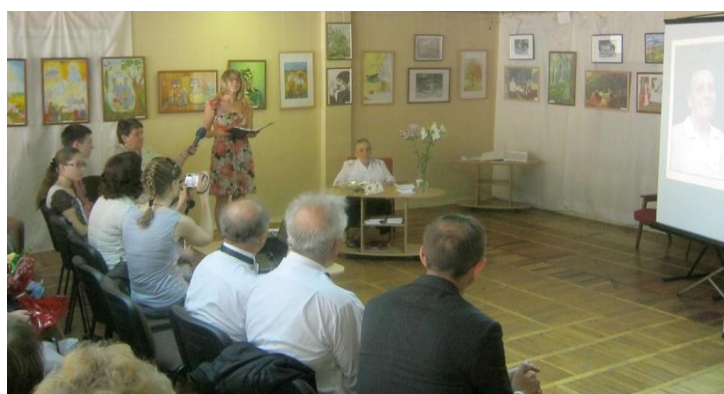
Відділ мистецтв бібліотеки