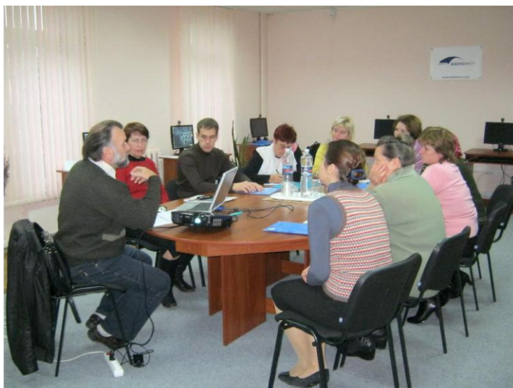
Регіональний тренінговий центр бібліотеки