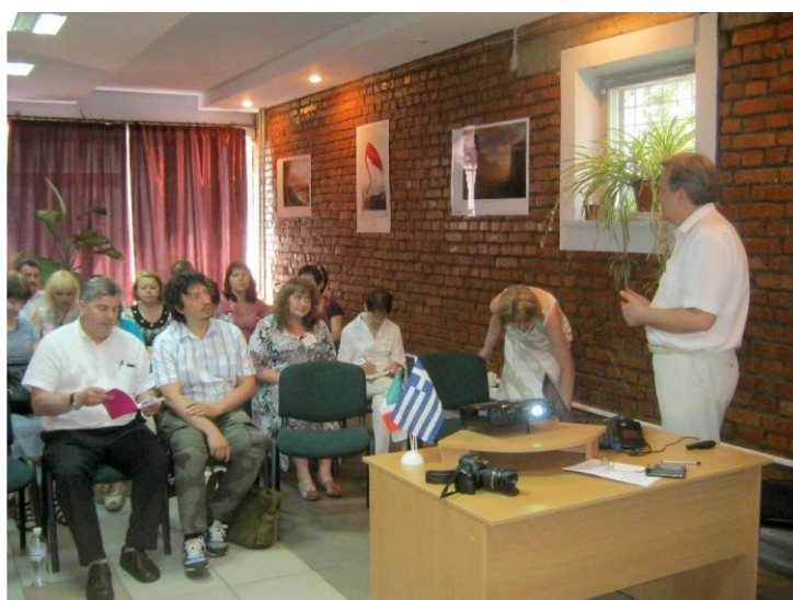
Інклюзивна читальна зала бібліотеки