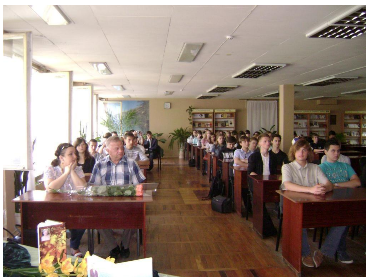
Читальна зала бібліотеки