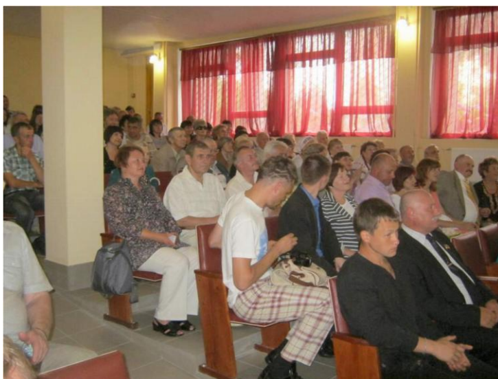
Актова зала бібліотеки