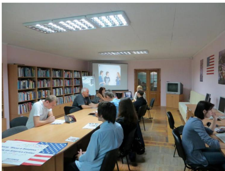
Інформаційно-ресурсний центр «Вікно в Америку»