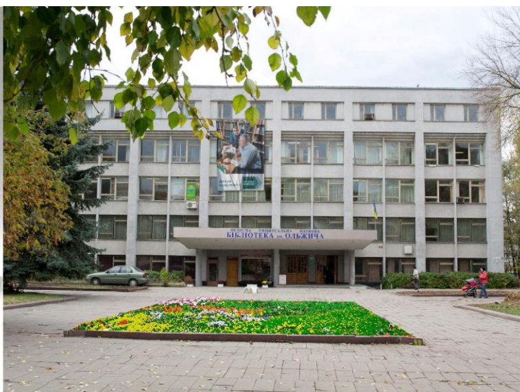
Сучасне приміщення ЖОУНБ імені Олега Ольжича

Кілька десятиліть, до початку 1990-х років, у повній назві бібліотеки значалось – «імені Жовтневої революції». Згідно з розпорядженням голови облдержадміністрації від 22.11.2007 р. за № 393 Житомирській ОУНБ присвоєно ім'я Олега Ольжича – учасника українського визвольного руху, визначного громадсько-політичного діяча, вченого, поета і публіциста. Бібліотека перебуває у віданні Житомирської обласної ради.